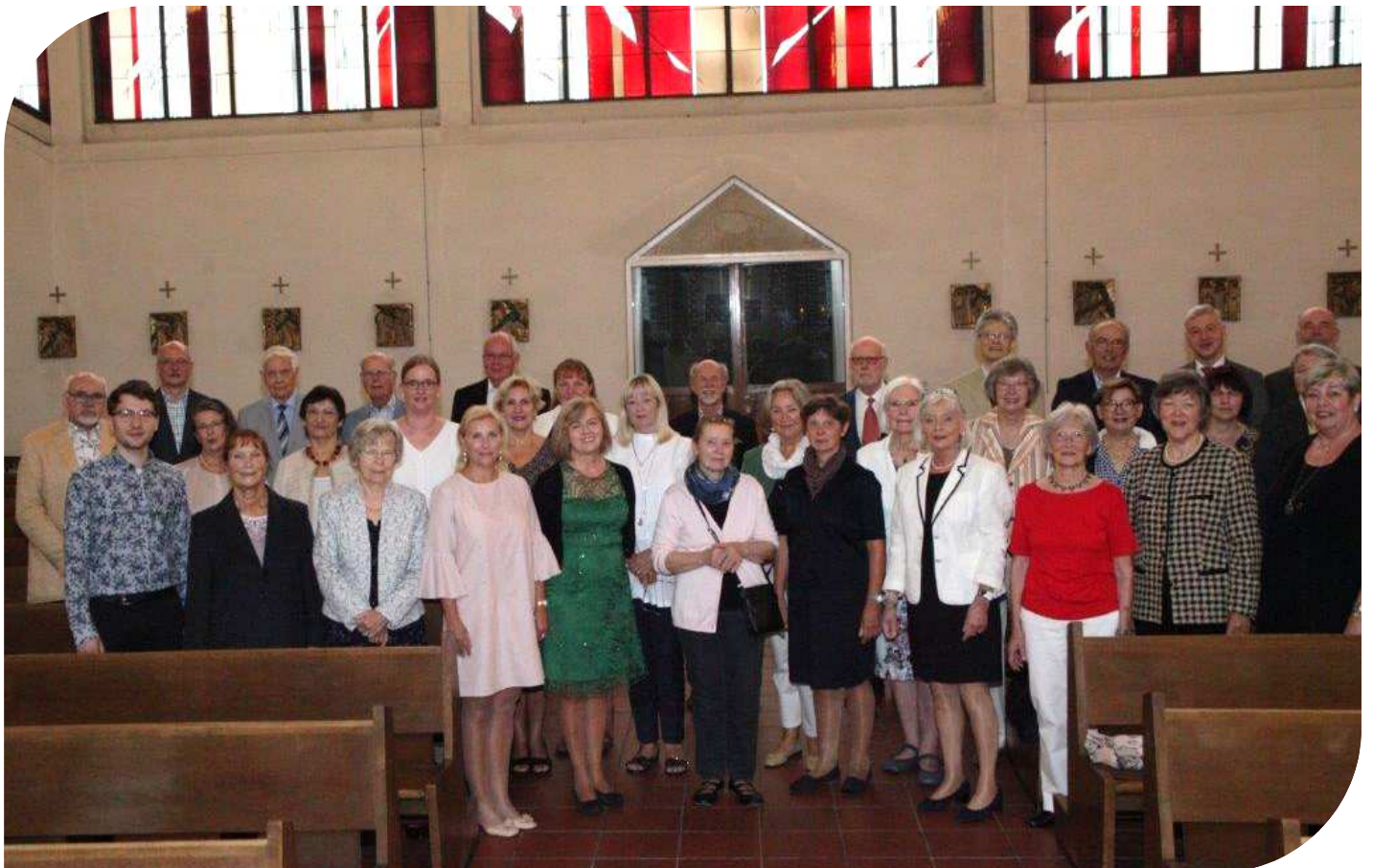
Chor unserer Gemeinde